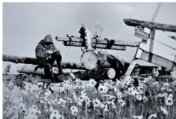
Енисейский заливю 1980 год.