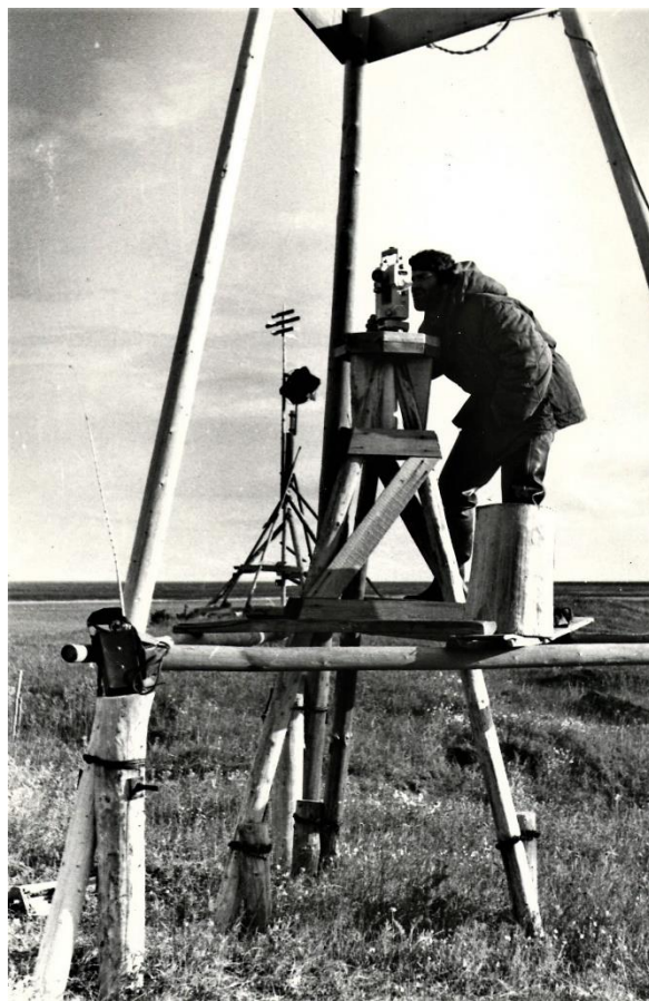
Работы на береговом знаке. Р. Енисей. 1979 год.