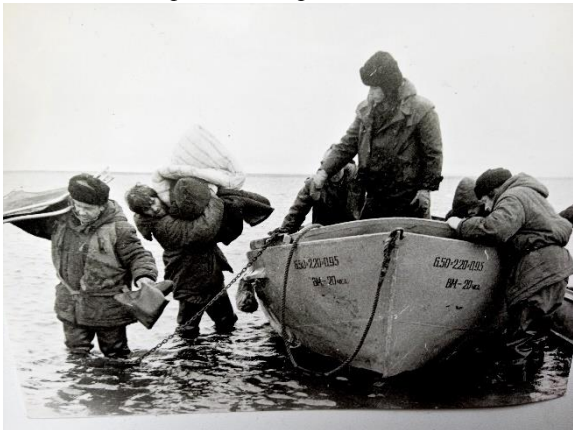
Доставка груза на берег, л/с «Лот». 1980 г.