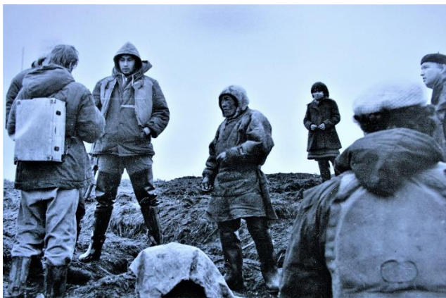
Общение с местными жителями. Побережье р. Енисей. 1979 год.