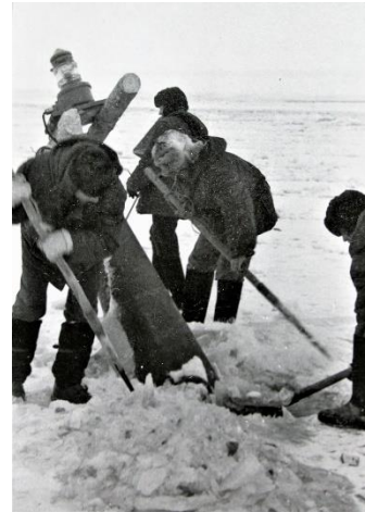
Вырубка бுவ. Енисей, Октябрь 1979 года.