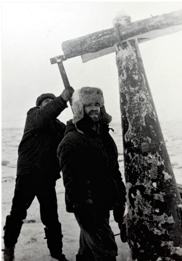
Автор у очередного берегового знака. Р. Енисей. 1979 год.