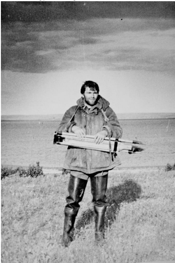
Пешком на береговой знак. Автор. 1980 г.