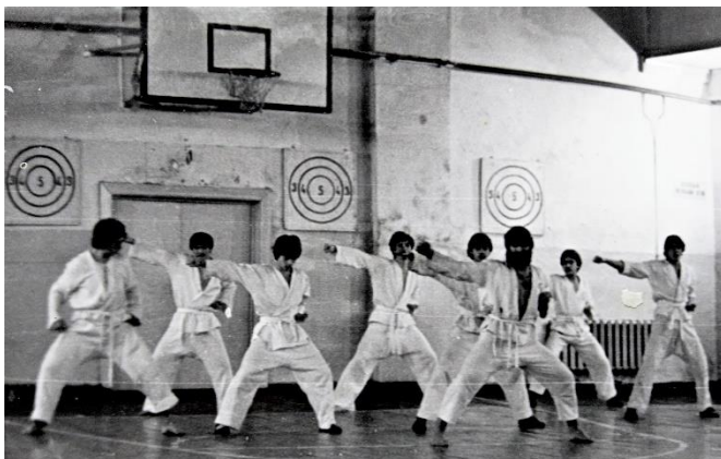
Члены игарского клуба каратэ. 1981 год.