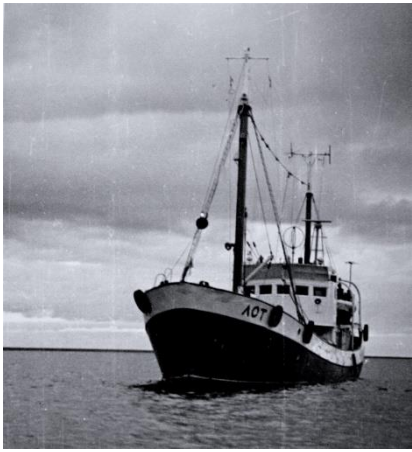
Лоцмейстерское судно «Лот». Игарская г/б. 1979 год.