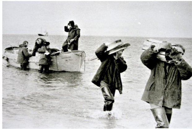
Доставка груза на берег, л/с «Лот». 1980 г.