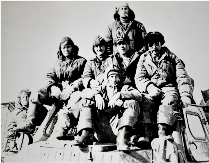
Лоцместерская бригада. 1979 год.