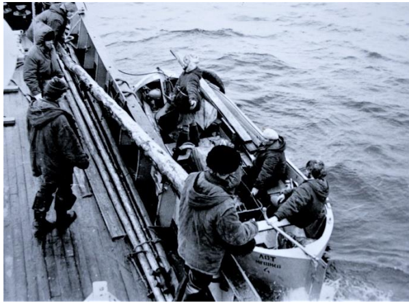
Выгрузка маячного оборудования с борта судна «Лот». 1980 г.