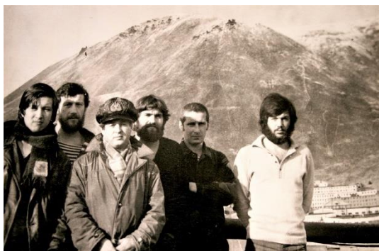
Техники-гидрографы л/к «Седов» в Бухте Провидения. 1977 год.