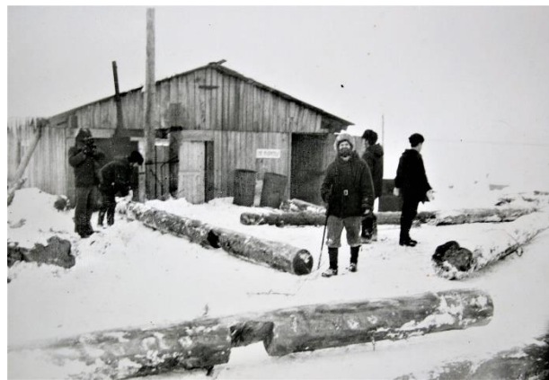
Субботник на Игарской гидробазе