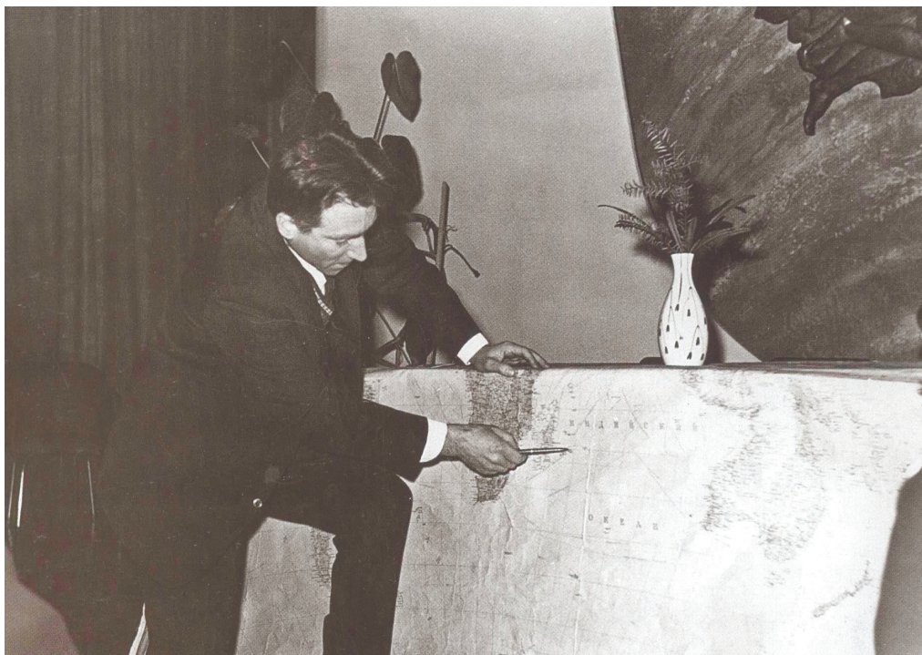
На встрече с курсантами ВВМУ им. М.В. Фрунзе. 1972 год

Главная подлость любой аварии в том, что она, ведьма, прилетает на метле или в ступе всегда неожиданно.