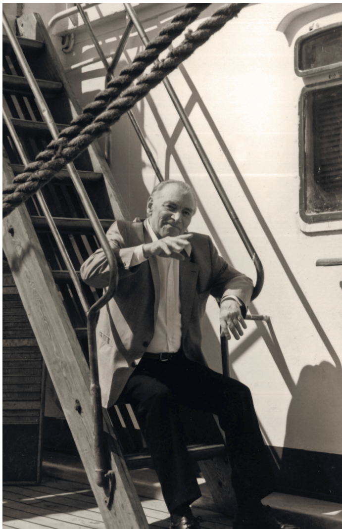
На паруснике «Седов». 2000 год

Они будут удивляться вопиющей бесхозяйственности в расходовании мозговой энергии. Миллионы тонн мозгового вещества в головах человечества работают вхолостую. Представьте себе Азовское море, заполненное до краев серым человеческим мозгом. И вся эта масса мозга решает вопрос: пойти в кино или нет?