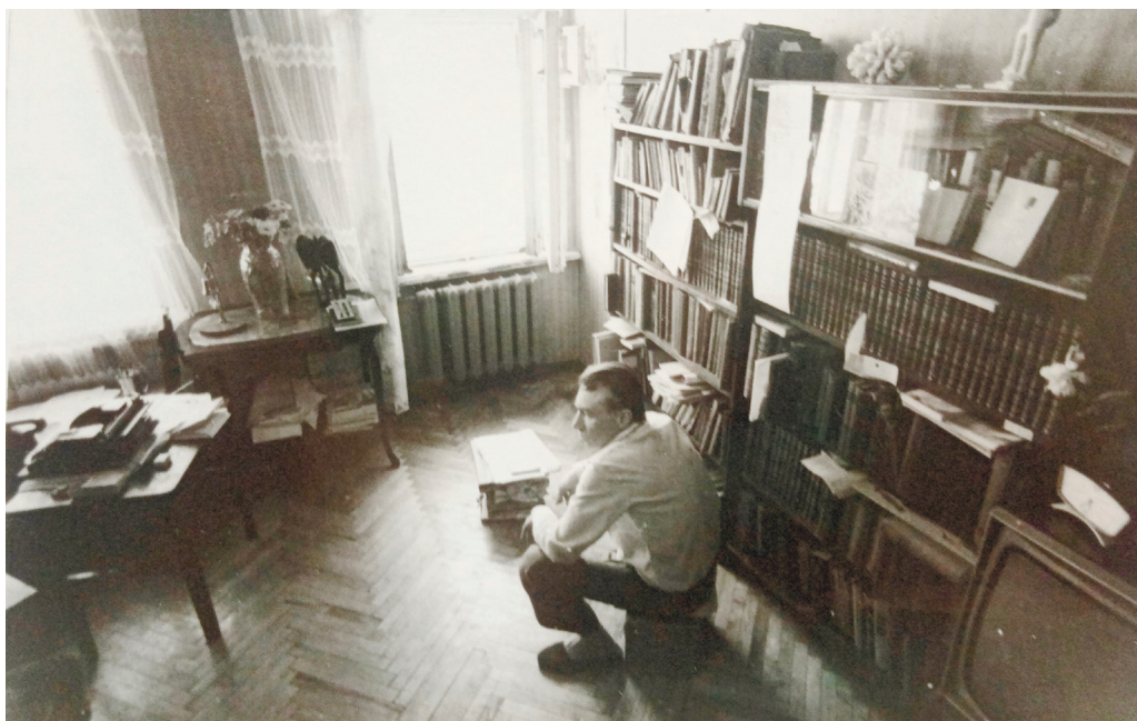
В доме на улице Ленина. 1983 год

Никто пути пройденного у нас не отберет. День рождения старпома у мыса Могильный