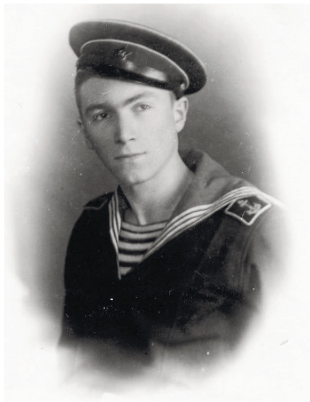
Виктор Конецкий. 1948 год

Наша юность начиналась на площадях. Два раза училище участвовало в общевоинских парадах на Красной площади. И раз пятнадцать на Дворцовой.