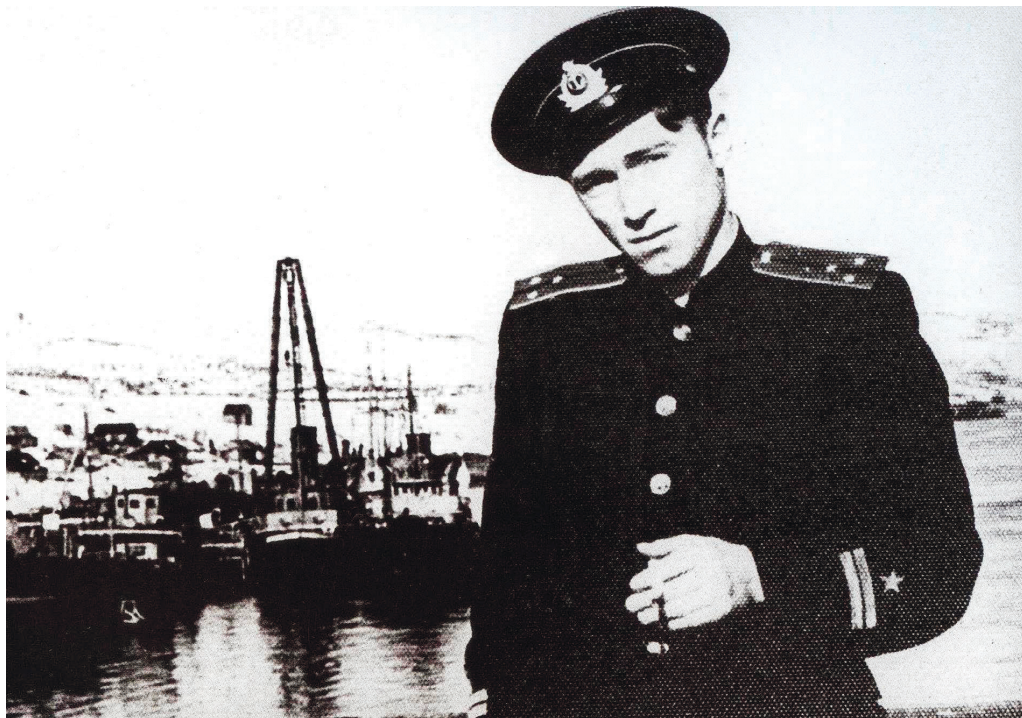
На Северном флоте. 1953 год

...Проходим Кильдин. Гляжу в бинокль на камни Сундуки. Страшные минуты пережиты там. Обидно, что куда-то запропастились документы, которые хранил после окончания следствия по делу о спасении нами СРТ-188.