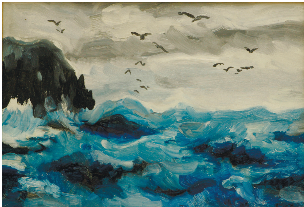
Виктор Конечкий «Прибой». Масло. 1999 год