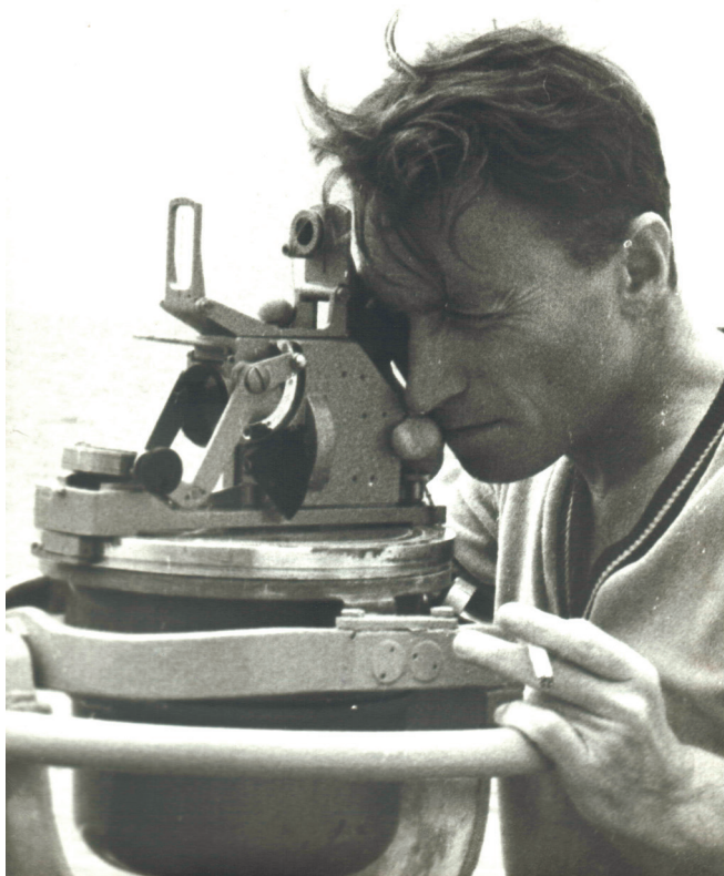
В море на «Невеле». 1969 год